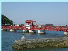
赤橋（国重要文化財）