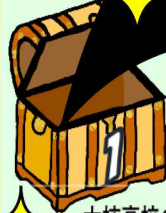
大柿高校の全校生徒数