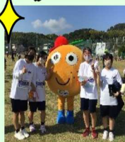
地元の人達と協力して天然芝を植えました

広島県の公立高校で初めての天然 芝。高校の魅力を上向きさせようと地元 の方や小・中学生、約 200 人が参加し、 天然芝を植えました。今では、保育園児 が凧あげなどで遊びに来てくれる憩い の場となっています。また、ヒロシマ MIKAN マラソンのゴールは、大柿高校 のグラウンドです。