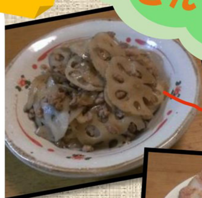
レンコンのきんぴら